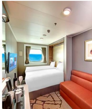
Oceanview Stateroom with Window