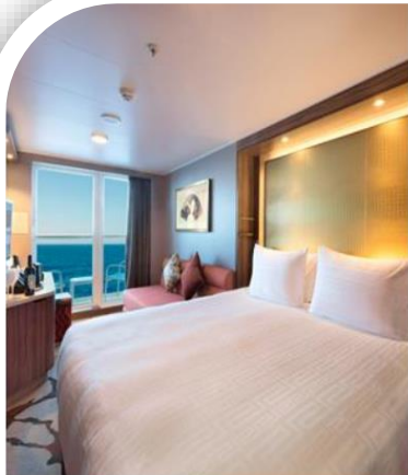
Oceanview Stateroom with Balcony